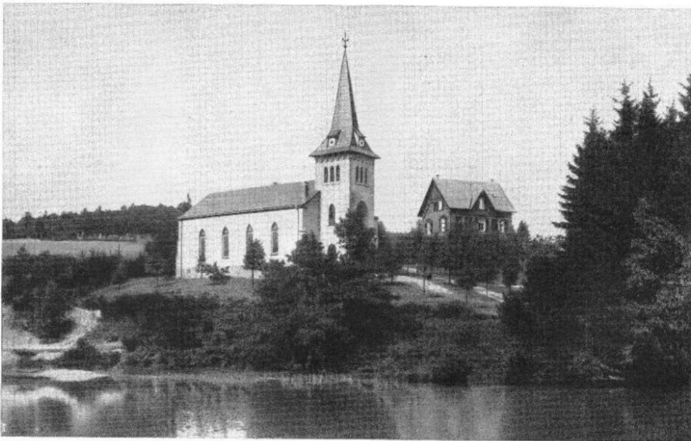
Pastor Christliebs Pfarrhaus, Kirche und letzte Ruhestätte (Das Zimmer links von dem geöffneten Mittelfenster war sein Arbeitszimmer)

Auf dem Nachhausewege trafen wir einen jungen Mann, mit dem wir uns anboten, da er auch nach Heidberg ging. Aus der Unterhaltung mit ihm konnten wir merken, wie das Christentum dort wirklich ins Volk gedrungen ist. Da war keine künstliche Salbung, aber eine so natürliche Art, alles unter christlichen Gesichtspunkt zu stellen, dass man von ihm viel lernen konnte. Er war ein einfacher Schuhmachergeselle, der später einmal Stadtmissionar zu werden gedachte.